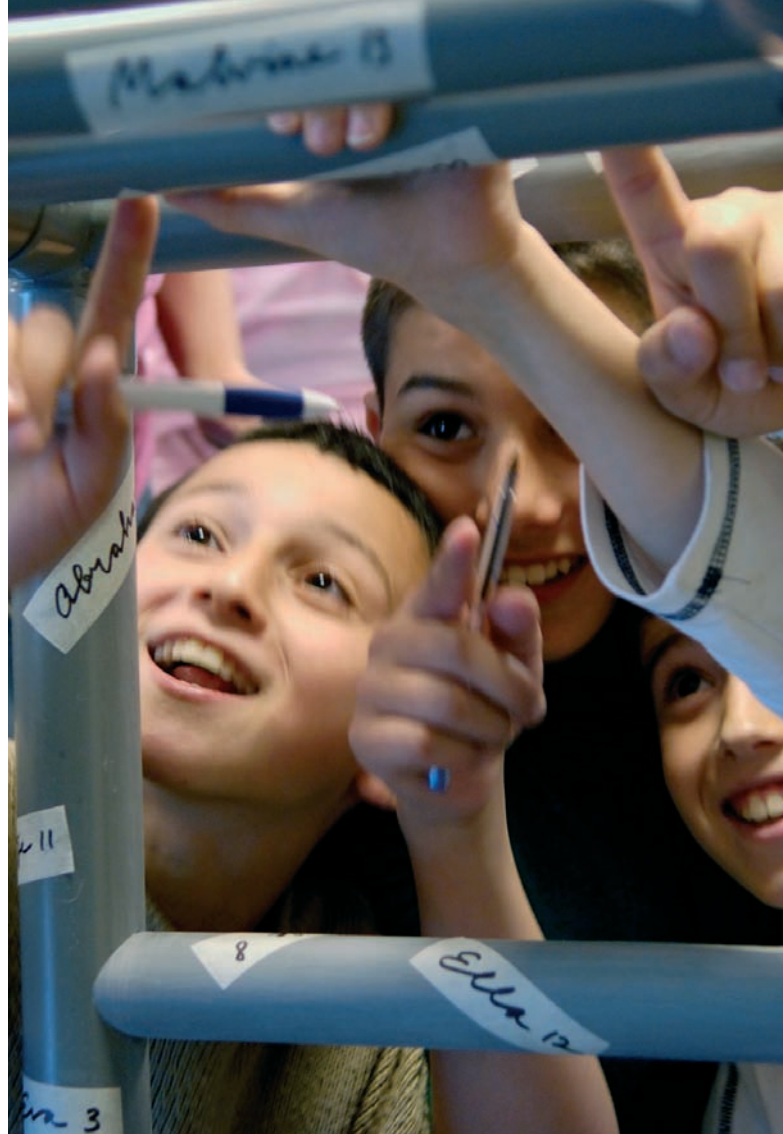
Leerlingen van de Prinses Marijke School in Den Haag schrijven namen en leeftijden van de weggevoerde kinderen op het monument

Ter herinnering aan de omgekomen joodse kinderen is het Joods Kindermonument opgericht op de plek waar destijds de joodse school stond. Deze plek wordt nu het 'Rabbin Maarsenplein' genoemd, naar de joodse geestelijke die veel heeft betekend voor de joodse gemeenschap in Den Haag en die in 1943 is gedood. Het kindermonument is tegelijkertijd een speelplek voor kinderen en een symbool van tolerantie en respect voor elkaars levenswijze.