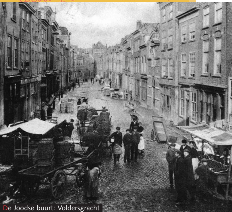
De Joodse buurt: Voldersgracht

De Duitsers gingen heel systematisch te werk om de Joden op te pakken. Omdat in Nederland iedereen netjes geregistreerd stond bij de burgerlijke stand was het heel makkelijk om erachter te komen wie Jood was. Die moesten een gele ster met zes punten, een Davidsster, dragen op hun jas. Daarop stond de letter J.